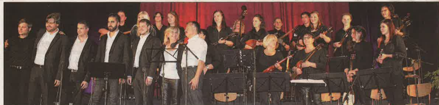
Das Tamburizza-Orchester „Ivan Vukovic“ begeisterte mit seinem Jubiläumskonzert das Publikum in der Stadthalle.